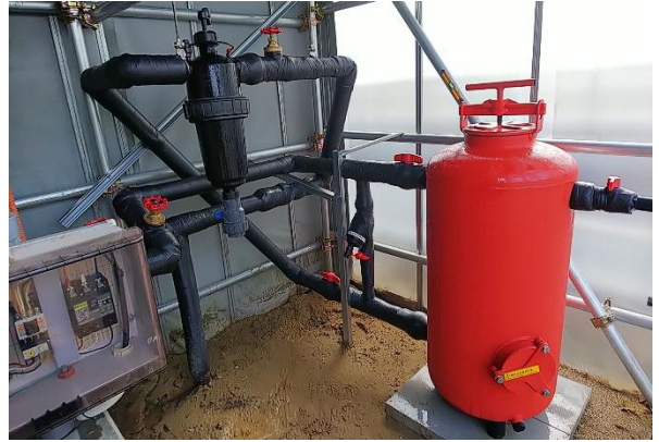
サンドフィルターユニット（手動式）

今年の猛暑時には大きく暑熱効果を体感できたと喜ばれました。 また、水質に砂と鉄分が多いことでお困りでしたが、今回の導入で水質も改善され、マイクロフォガーのノズルだけでなく、手漕水用のハスロの目詰まりも無くなり、作業効率が大きく改善されたと、大変喜ばれております。