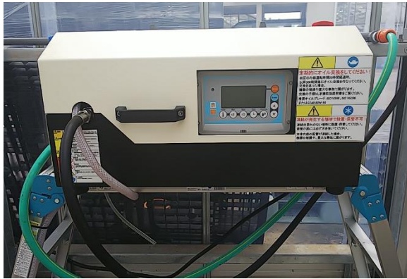
マイクロフォガーⅨ（9）型

千葉県の花苗生産者様に温室の暑熱対策として細霧冷房装置・大型マイクロフォガーを、水質改善としてサンドフィルターとプラスチックフィルターを導入していただきました。